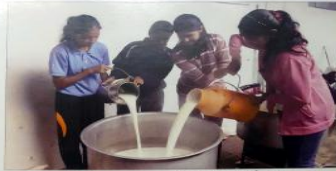
पद्मारजे मद्यस्कूल, शिरोळ येथे NCC च्या छात्रसेनिकांमार्फत दूध संकलन...