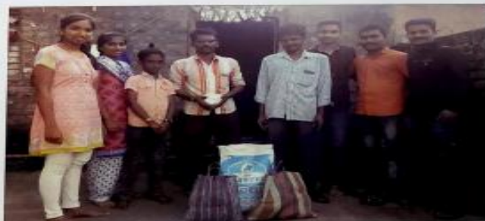
शिरोळमध्ये संकलित केलेले धान्य गरजू माझारिकांना वाटप करताना NCC छात्रसेनिक...