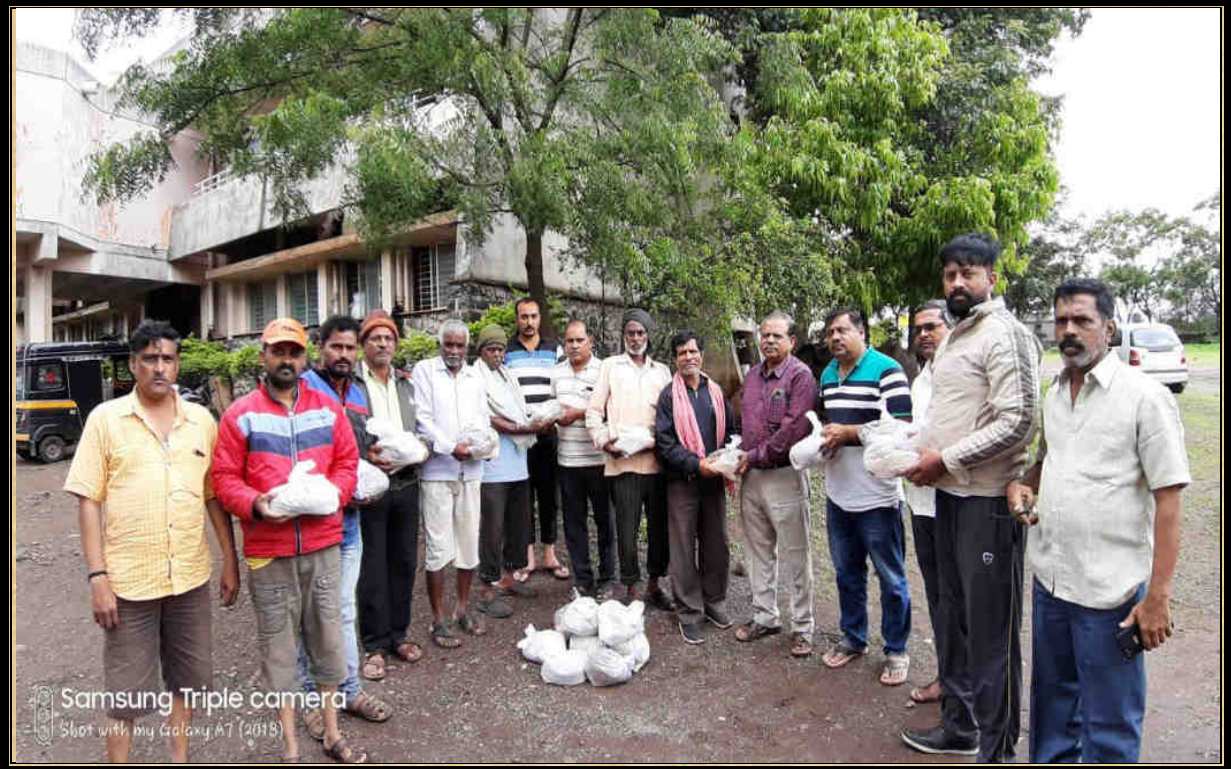
When submitting medical materials deposited in the college to the Medical Association